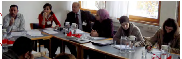
Syrien | Syria

Ziel des Projekts in Syrien ist die technische Unterstützung der Qualitätsinfrastruktur, insbesondere die Harmonisierung der technischen Gesetzgebung mit der EU. ASI ist an diesem dreijährigen Projekt v. a. an der Unterstützung und Beratung des Syrischen Normungsinstituts beteiligt.