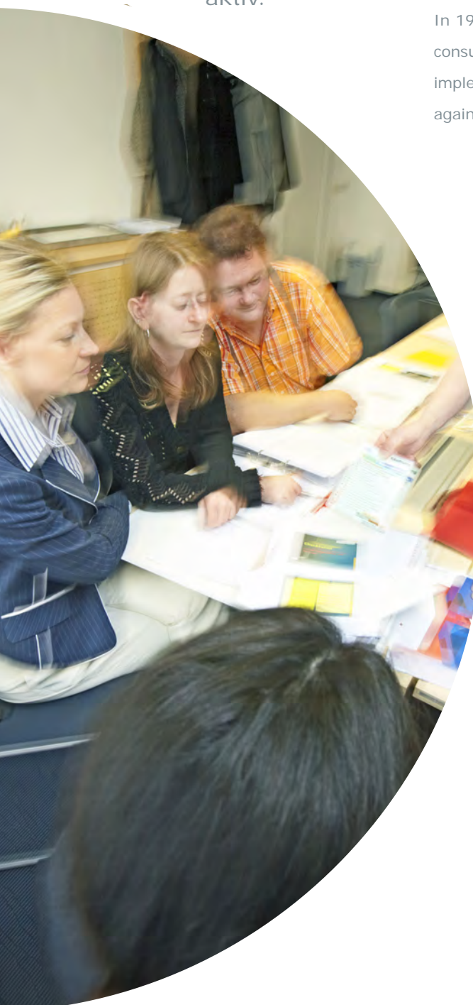
Twinning – China

In 1998, the Austrian Standards Institute launched international consulting activities. To date, more than 30 projects have been implemented. Together with international partners, ASI:C was again active in several countries in 2009.